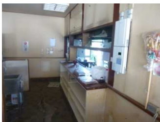
(空き店舗内飲食スペース)