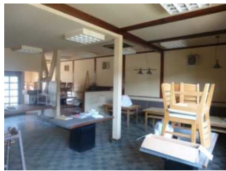
(空き店舗内飲食スペース)