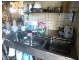
(空き店舗内厨房スペース)