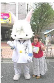
上:こーにゃんも応援に駆けつけてくれた日曜市出店 下:来年の全国大会は島根県

参加した当会部員はよい刺激を受け、これからの女性部活動の目標や主体的な事業へのヒントなど、各々が学ぶよい機会となりました。