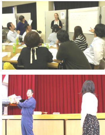
上…イギリス籍講師とのディスカッション 下…赤岡小学校での図書寄贈式

青年部では、平成26年より毎年11月、夏季事業収益の一部で香南市内小学校の子供達の教育に活かしていただく為に、図書寄贈を行っています。今年度も12日の赤岡小学校での贈呈式からスタートし、8校に計44冊の図書を寄贈していきます。