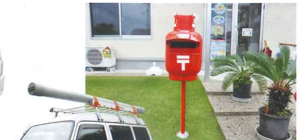
ガスボンベを再利用した可愛い郵便受け