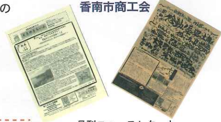
月刊ニュースレターと 完成見学会のチラシ