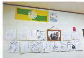
有名人も多く来店

厚みがあってボリュームたっぷり！生地はフワフワ。中は大きめの具がゴロゴロ♪甘すぎず辛すぎずマヨネーズにもピッタリの特製ブレンドソースは極上の味わい。テイクアウトもできます。