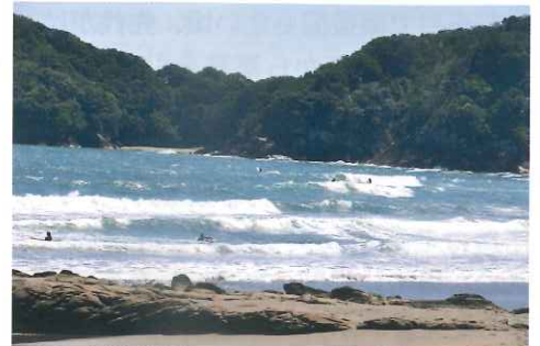
連日多くのサーファーが訪れる生見海岸