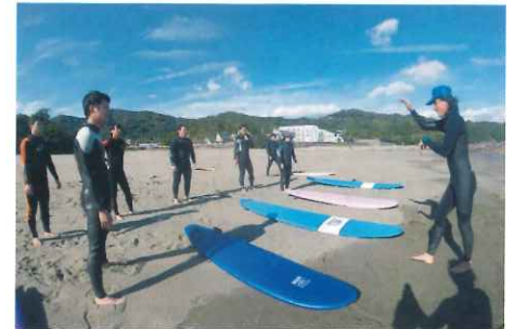
サーフィンスクール

してもらうことで初心者でも波に乗れるようになるそうです。上手に波に乗れた時、波の恐怖を感じることなく、サーフィンを楽しむことができます。近年はスポーツツーリズムの流行により全国から年齢・性別を問わず多くのお客様が体験に来ているということです。サーフィンにハマってしまい「自分の板が欲しい」というお客さんに、体や技術に合った板の長さ・厚さなどをアドバイスし、オーダーも受け付けています。