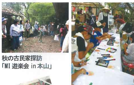
秋の古民家探訪 「MI 遊楽会 in 本山」