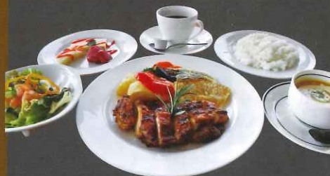
日替わりランチ (肉) 800円

スポーツ施設に併設していることから、学生の合宿に利用されることも多く、長期休暇は貸切の場合があるので、事前にご確認をお勧めします。団体利用の場合は、お値段に応じた料理も相談可能です。また、ボリューム満点の大人気お弁当(520円・おかずのみ350円)は村内に限り配達を承っております。