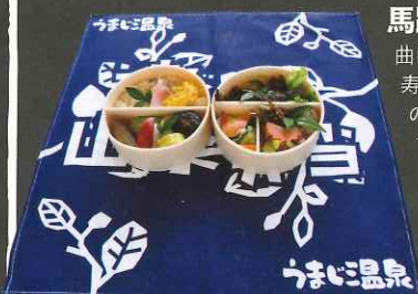
馬路温泉前駅弁当 1,000円

馬路村の料理といえばまず田舎寿司。柚子酢が効いた酢飯の上には地元の山菜をのせています。椎茸・こんにゃく・タケノコ・ミョウガ、春なら山葵の葉・山葵が終わればリュウキュウ。安田川で採れた鮎やアメゴも絶品です。