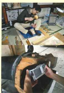
に、文化を 胎内カメ 像がないと お赤外線 の赤外線 中赤外線 修理専用の 墨財専用で 確認して

吉田さんの彫刻技術は評価が高く、最近では企業のシンボルとなるモニユメントの制作依頼もあります。