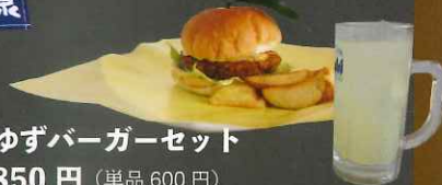
ゆずバーガーセット 850円 (単品600円)

曲げわっぱ風のお弁当箱に二段重ねで田舎寿司と五目寿司とアメゴの甘露煮や山菜のおかずが入っています。特製の風呂敷で包み、馬路村がギュッと詰まっています。日曜・祝日に限定10個の販売。予約は平日も可能。