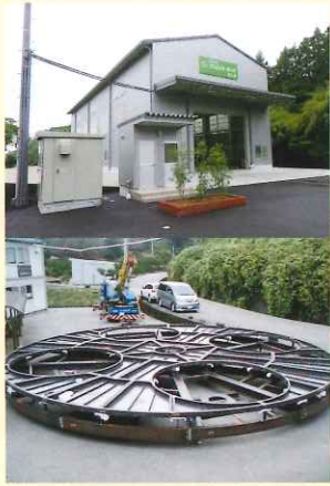
テーマパーク ティーカップ回転フロアー

香南市ものづくりネットワーク https://www.city.kochi-konan.lg.jp/monodukuri/