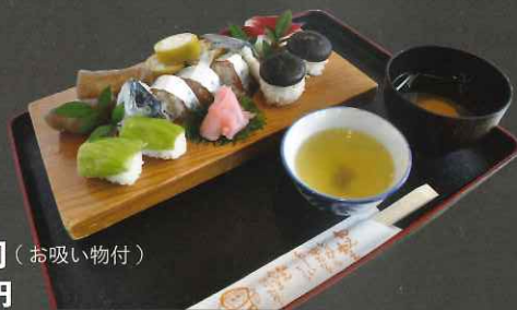
田舎寿司 (お吸い物付) 1,450円

馬路温泉で温泉・宿泊と並ぶ人気レストランでのお食事。馬路村のおいしい川の幸、山の幸の旬を味わうことができます。恵まれた自然の中にある馬路温泉でのんびり過ごしてみませんか？