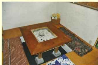
食堂の利用は要問合せ