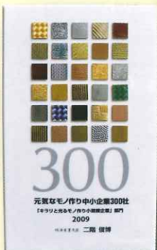
「元気なモノ作り 中小企業300社」受賞