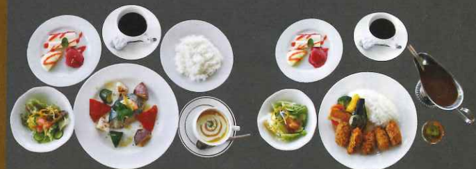
日替わりランチ (魚) 800円