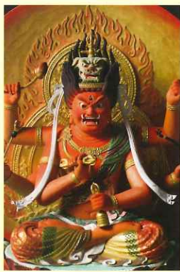
あいぜんみょうおうざぞう 愛染明王坐像