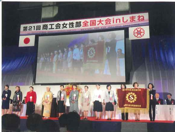
全女性連から開催県への大会旗引継ぎ

令和元年 10 月 29 日に島根県松江市総合体育館で女性部全国大会が開催されました。2,000 名を超える参加者のなか、高知県からは 26 名が参加し、大会式典、主張発表大会、講演会が行われました。主張発表大会では、女性部活動やまちづくりをテーマに、地域特産品を使った商品開発や多言語会話集制作などの取り組みについて発表があり、参加者