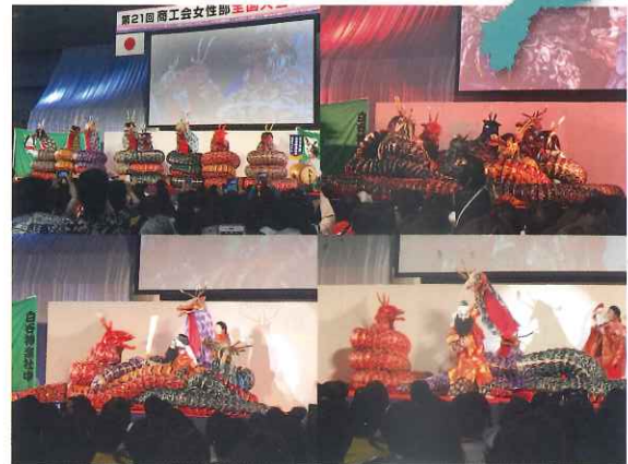
オープニングセレモニーの神楽

令和元年 10 月 29 日に島根県松江市総合体育館で女性部全国大会が開催されました。2,000 名を超える参加者のなか、高知県からは 26 名が参加し、大会式典、主張発表大会、講演会が行われました。主張発表大会では、女性部活動やまちづくりをテーマに、地域特産品を使った商品開発や多言語会話集制作などの取り組みについて発表があり、参加者