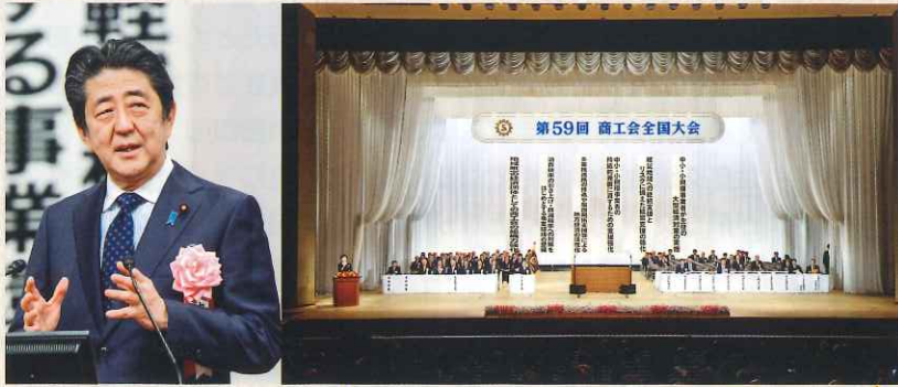
安倍内閣総理大臣祝辞