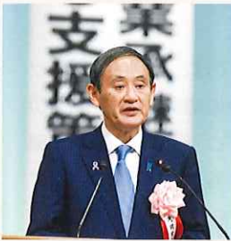
菅義偉内閣官房長官祝辞