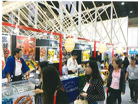
タイ食品展示会「Thaifex」での高知県企業出展ブース

ジェットロ高知では企業様のニーズ・国の施策に基づいた様々な事業を実施しています。今回はジェットロ高知の主な海外展開支援事業について、ご紹介いたします。どうぞお気軽にご相談ください。