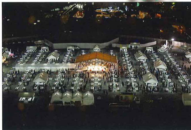
上空から撮影した懇親会会場（旧広島市民球場跡）

平成30年11月21、22日、広島グリーンアリーナで青年部全国大会が開催されました。『〇～和我技笑話環～』を大会スローガンに、全国から商工会青年部員ら3,700名以上が集結し、高知県からは27名が参加しました。