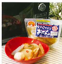
室戸のこだわりおでん