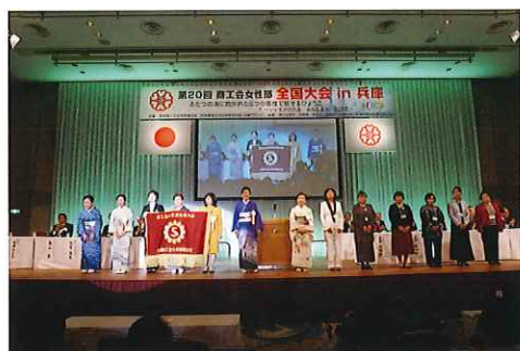
全女性連から開催県への大会旗引継ぎ