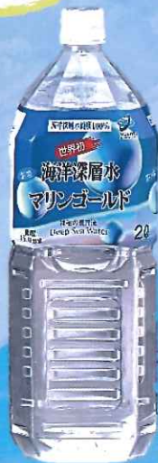
室戸の海洋深層水 マリンゴールド *2L/500ml