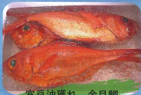
室戸沖獲れ 金目鯛