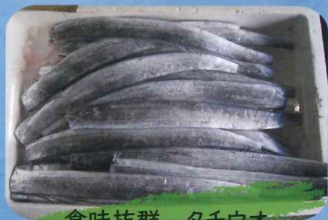
食味抜群 タチウオ