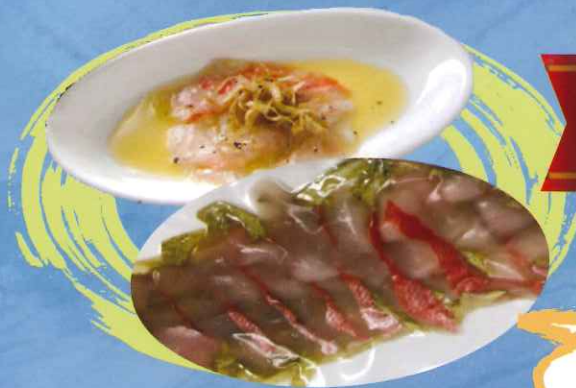
熟成金目鯛の白板昆布まぶし