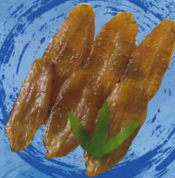
ふぐのみりん干し