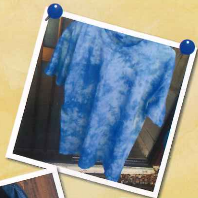
人気の藍マーブル