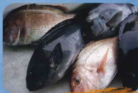
新鮮詰合せ グレ・タイ