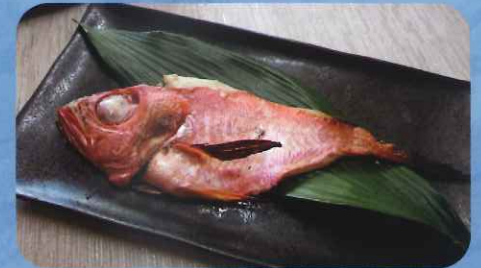
高級金目鯛の塩糍漬け