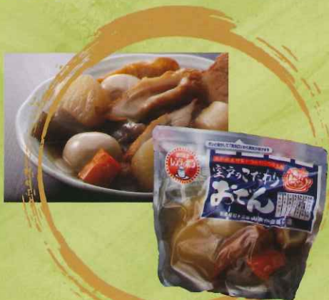
室戸のこだわりおでん