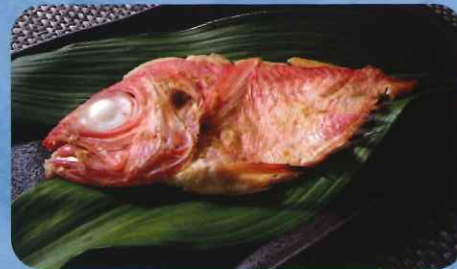
高級金目鯛の味噌漬け