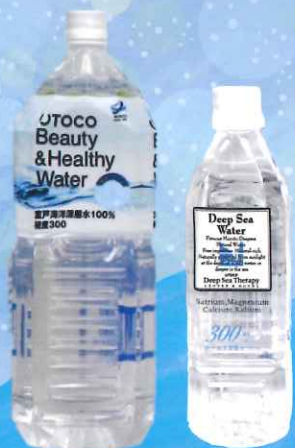
ウトコビューティー & ヘルシーウォーター *2L/500ml

ミネラルがどっさり入っちゃうと! 飲めば飲むほど べっぴんになれるような気がするやか! (・v・)ニヤニヤ