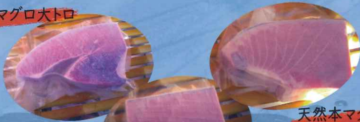
天然本マグロ大トロ