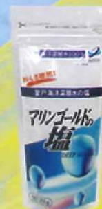
マリンゴールドの塩 *200g/100g