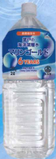
室戸の海洋深層水 マリンゴールド 6YEARS *2L