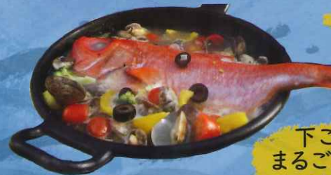
下ごしらえなし まるごと1尾金目鯛