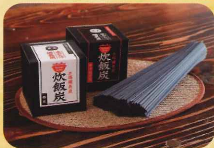
炊飯炭・炭うどん