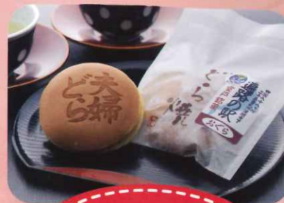
夫婦どら (小倉・栗・ゆず)