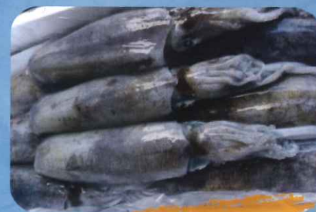
晩酌のお供に イカ