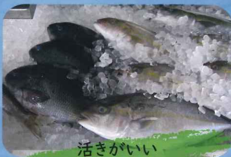
活きがいい グレ・カンパチ