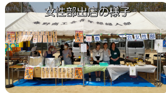
女性部出店の様子