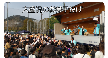
大盛況のお菓子投げ