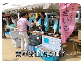
青年部出店の様子