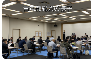
青年部総会の様子