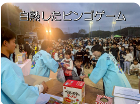
白熱したビンゴゲーム