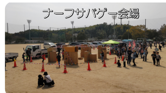
ナーフサバゲ会場