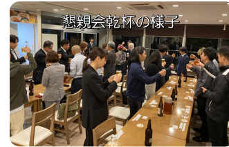
懇親会乾杯の様子

ご関心のある方がいらっしゃいましたら、女性部員または事務局までお気軽にお問合せください。