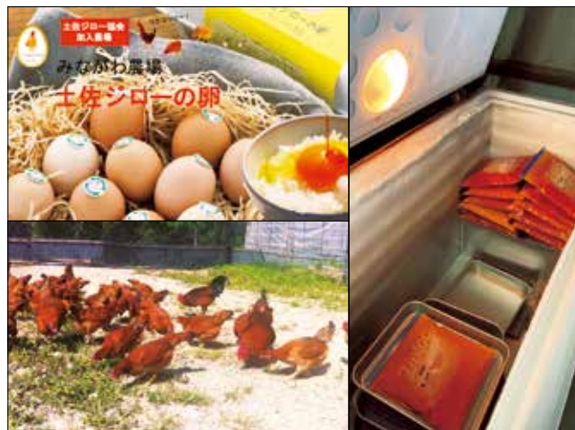
左上:土佐ジロー卵 左下:土佐ジロー鶏 右:液卵の冷凍保存