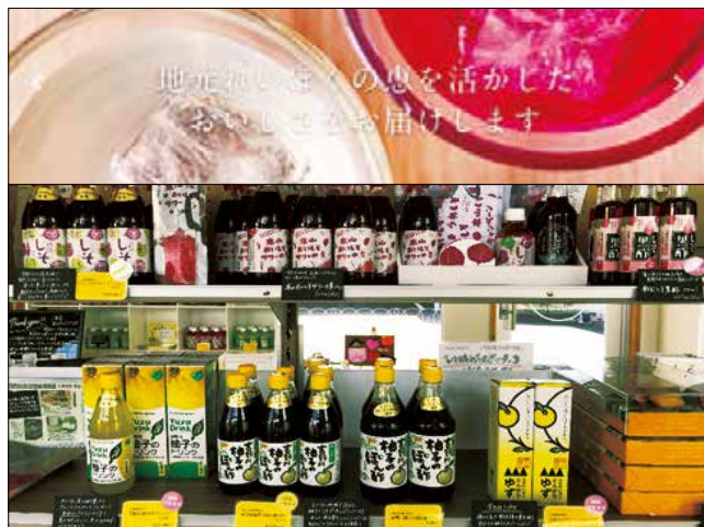
上:トップページ 下:商品ラインナップ