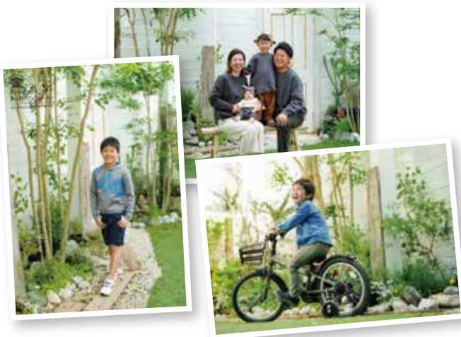
ガーデンスタジオでの撮影例