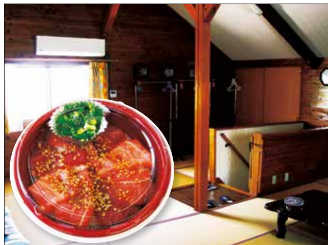
マグロ丼 ふれあいの宿 海遊里