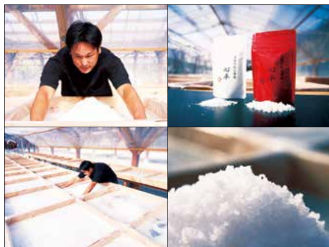
太陽光のみで2ヶ月かけて製塩