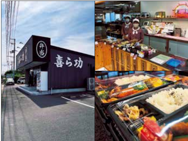
お店の外観・店内の様子