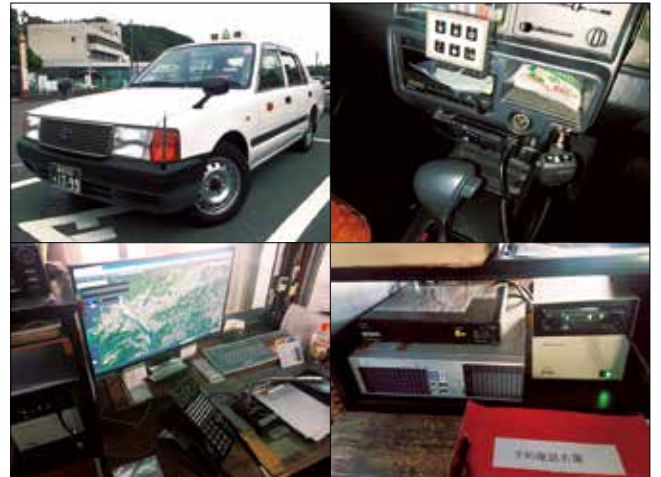
IP無線機（本社・車両）