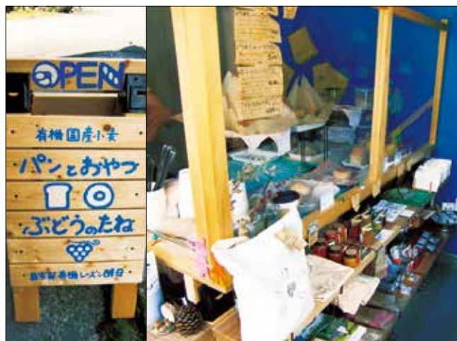
山の宝満載のパンとおやつを提供しています