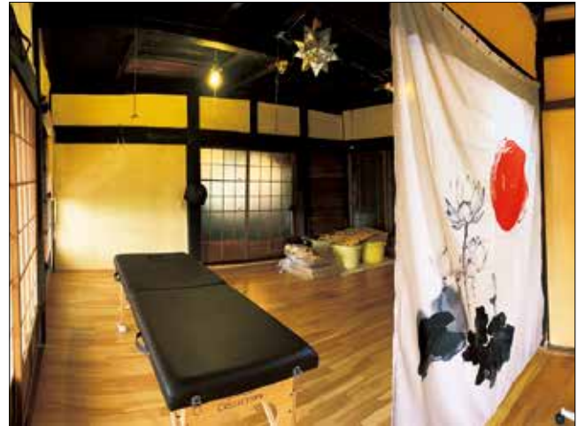
カウンセリング室