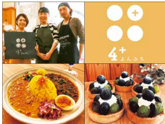
3名のチャレンジャーと店のロゴ(上)カレーとタルト(下)