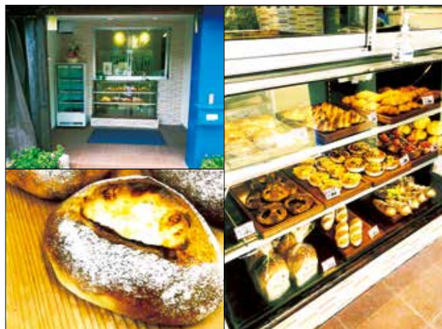
店舗外観(左上)、チーズクッペ(左下)、様々なパンを販売しています(右)