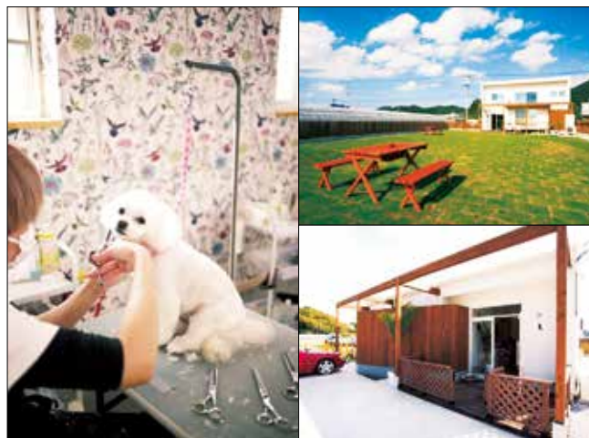
左:トリミング室 右上:ドッグラン 右下:店舗外観