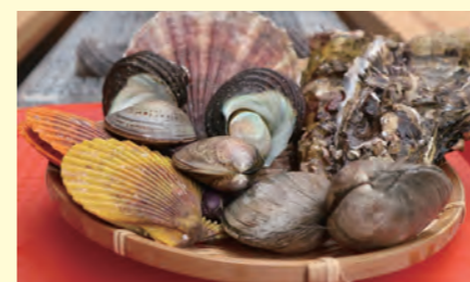
イチオシ！浜焼き海王の炭火で頂く海王セット