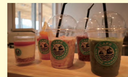
カフェマルシェなかとさ 地元野菜・果物の絶品スムージー