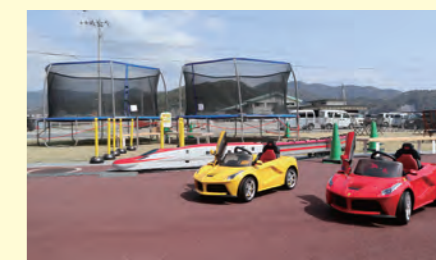
遊具が充実 家族連れに人気のちびっこ広場