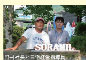
野村社長と三宅経営指導員