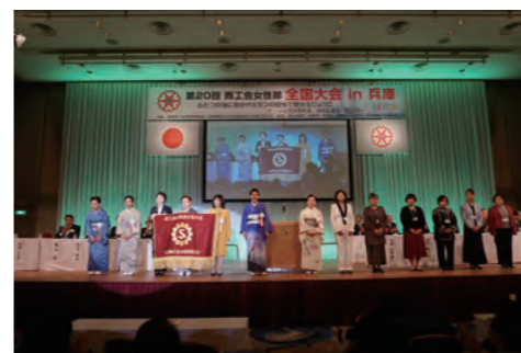
全女性連から開催県への大会旗引継ぎ