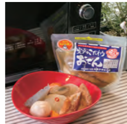
室戸のこだわりおでん