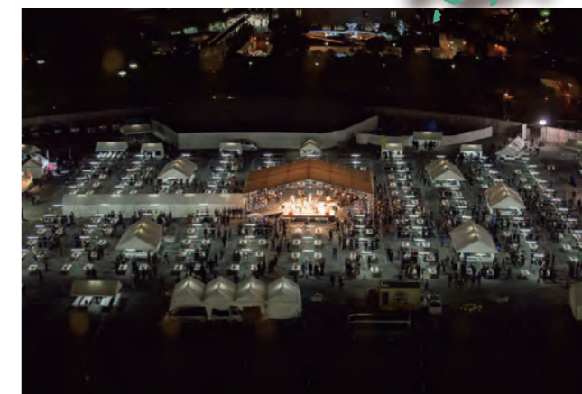
上空から撮影した懇親会会場（旧広島市民球場跡）

青年部部員増強運動表彰において土佐市商工会青年部が、部員数増加数全国 2 位、新規加入部員数全国 2 位に選ばれました。また、7 月の西日本豪雨災害時の取組を評価され、高知県青連として中小企業庁長官感謝状をいただく事も出