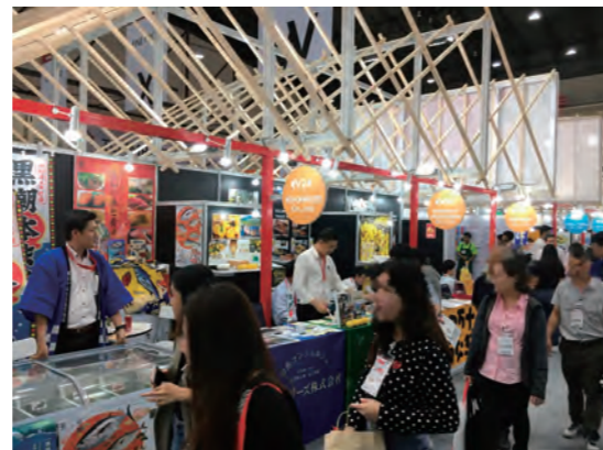
タイ食品展示会「Thaifex」での高知県企業出展ブース

ジェトロ高知では企業様のニーズ・国の施策に基づいた様々な事業を実施しています。今回はジェトロ高知の主な海外展開支援事業について、ご紹介いたします。どうぞお気軽にご相談ください。