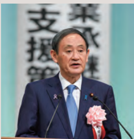
菅義偉内閣官房長官祝辞