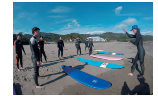
サーフィンスクール

してもらって初めて初心者でも波に乗れるようになるそうです。上手に波に乗れた時、波の恐怖を感じるのではなく、サーフィンを楽しむことができます。近年はスポーツツーリズムの流行により全国から年齢・性別を問わず多くのお客様が体験に来ているということです。サーフィンにハマってしまい「自分の板が欲しい」というお客さんに、体や技術に合った板の長さ・厚さなどをアドバイスし、オーダーも受け付けています。