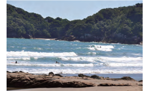
連日多くのサーファーが訪れる生見海岸