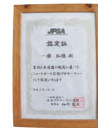
日本プロサーフィン連盟認定 「ショートボード公認プロサーファー認定書」