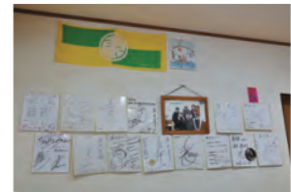
有名人も多く来店

厚みがあってボリュームたっぷり！生地はフワフワ。中は大きめの具がゴロゴロ♪甘すぎず辛すぎずマヨネーズにもピッタリの特製ブレンドソースは極上の味わい。テイクアウトもできます。