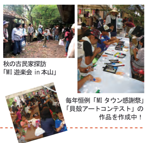
秋の古民家探訪 「MI 遊楽会 in 本山」