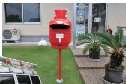
ガスボンベを再利用した可愛い郵便受け