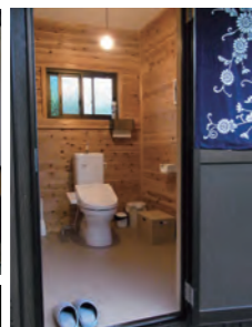
小さなお子様でも安心して使える広さ