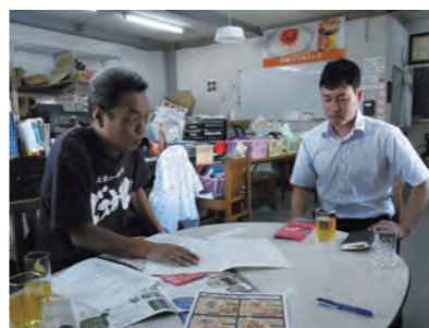
商工会の経営指導員と二人三脚で