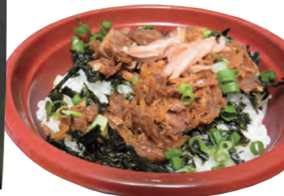
漁師のぶっかけ丼 (テイクアウト)