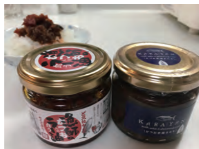
根強い人気の漁師のラー油 (左)、カラヤン (右)