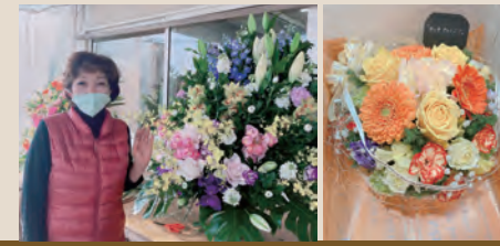
フローリストルミ 本店

本店 南国市岡豊町小籠 415-10 【電話】088-863-3998 【定休日】日曜日 【営業時間】9:00 ~ 18:00 サニーアクシス南国店 南国市大浦乙 1009-1 【電話】088-864-2664 【定休日】なし 【営業時間】9:00 ~ 19:00