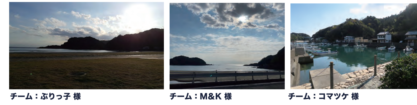
チーム：ぶりっ子様