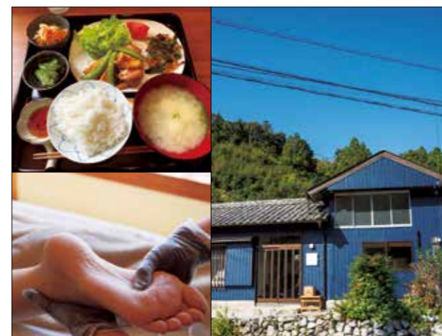
日替わりランチ・トリートメント・外観