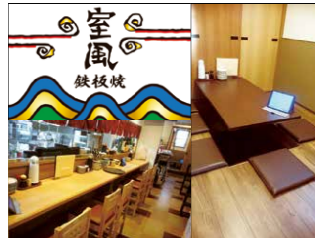
ロゴ(上段左)・店内写真(下段左)・個室写真(右)