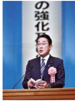
挨拶する岸田首相

その他経営改善普及事業および共済事業等の功労者を称えるとともに、「会員あつての商工会」を念頭に、「一層信頼できる組織を目指し全国の中小企業・小規模事業者が希望をもって挑戦・成長できるように事業者支援に全力を挙げていく決意とともに、事業者支援の実現を図るべく次の項目が大会決議として採択されました。」