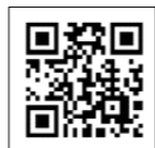
確定申告書等作成コーナー