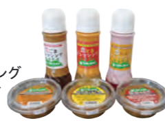
自家製ドレッシング 自家製味噌