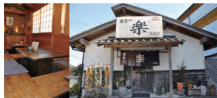
遊食や 楽 【営業時間】18:00 ~ 23:00 【定休日】日曜