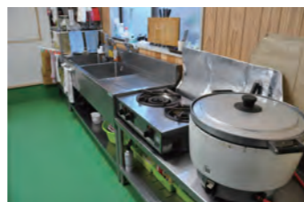
小規模事業者持続化補助金を活用し増設した加工場